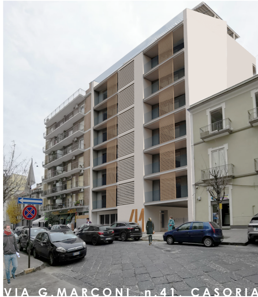
VIA G. MARCONI n. 41, CASORIA

Un edificio moderno ed efficiente nel cuore di Casoria, linee essenziali e giochi di luce garantiti dalle lamelle orientabili delle schermature solari poste in facciata. Sviluppato su 6 livelli, le 12 soluzioni abitative, di ampia metratura, sono raggiungibili attraverso una scala interna e un comodo ascensore che scende sino a livello dei box auto.